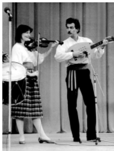
В ансамбле В. Назарова, 1985 г.

рекупщика наркотиков». 1986 г. — участник концертов в зоне аварии для ликвидаторов катастрофы на Чернобыльской АЭС. В 1987 г. он играет на свадьбе дочери короля Хусейна I, от которого получает в подарок золотые часы «Лонжин» с именной надписью. Затем он едет в Калькутту и работает в Армии спасения вместе с матерью Терезой. В 1989 г. он вместе со всеми крушит Берлинскую стену, а затем присоединяется к группе энтузиастов, готовящих суперпроект «Стена» группы «Пинк Флойд». В начале 1990-х серьезно изучает тувинское горловое пение и организует несколько фестивалей якутской музыки в Европе. В 1992 г. в Дюссельдорфе, где он пытался открыть якутский фольклорный центр, конфликтует с гвардейцами чеченского лидера Дудаева. С 1994 г. он даже дважды становился представителем одной американской корпорации, работающей на рынке ценных бумаг, но быстро разочаро-