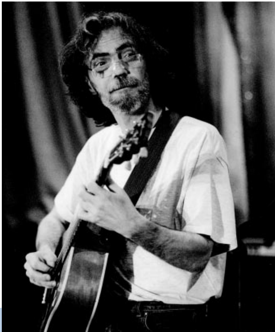
Пушино, июнь 2003 г.