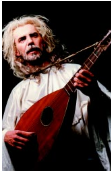
Кадр из клипа «Мамакабо».