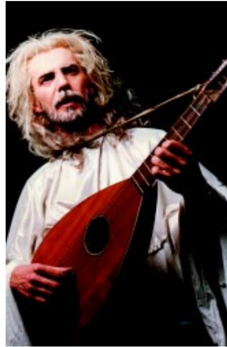
Кадр из клипа «Мамакабо».