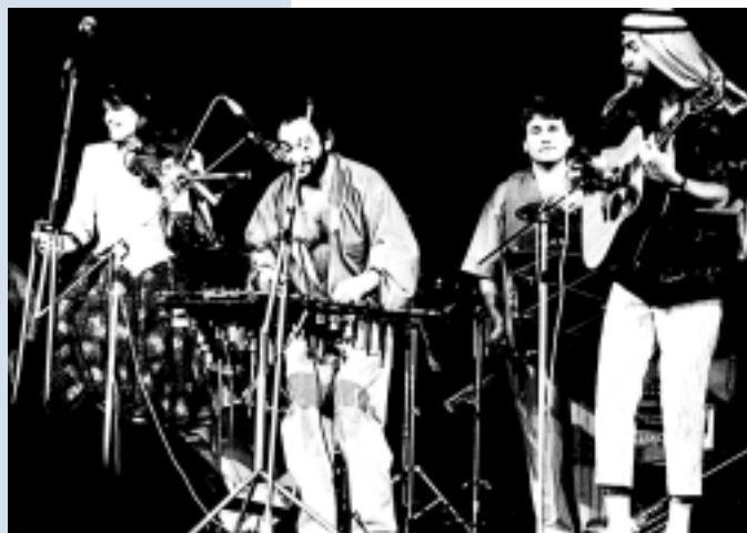
Ансамбль «Своя игра», 1989 г.