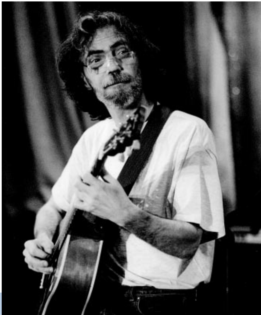
Пушино, июнь 2003 г.