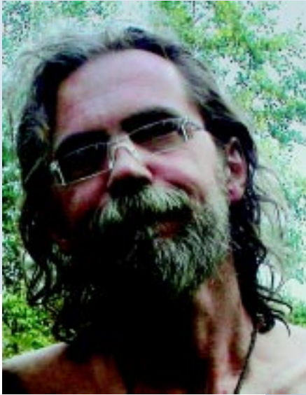
Волжск, август 2003 г.

В нем, в его музыке ощущается какой-то дух свободы и романтизма. Но его «хиппизм» выразился в музыке как-то по-русски — он сумел удивительным образом соединить блюзы, рэг-таймы, пьесы в стиле кантри, латиноамериканские направления, а также вальсы и даже марши в единую музыкальную картину. И весь компакт-диск, все разностилевые пьесы слушаются