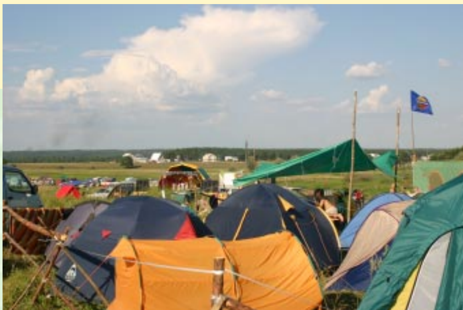
Гостевой палаточный лагерь.