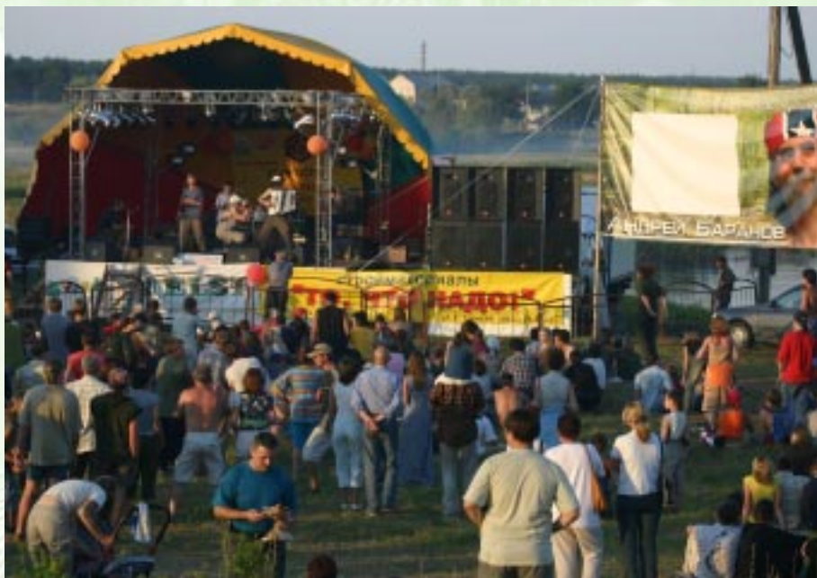
Фестиваль открыт. Народ подтягивается.

каны задают друг другу вопросы: что такое формат, кто и по каким критериям его определяет, кто решает «что такое хорошо и что такое плохо», почему в спектре российской музыкальной культуры отсутствуют целые музыкальные пласты, не говоря уж об отдельных стилях... Вопросов много. Говорят, что музыку заказывает тот, кто платит... Исполнительные директора, подстраивающиеся под вкусы «хозяина», опираются на какие-то рейтинги, утверждая, что они точно знают, что хочет «этот народ». Правда, как происходит этот таинственный подсчет рейтингов и насколько это все объективно, сказать очень трудно.