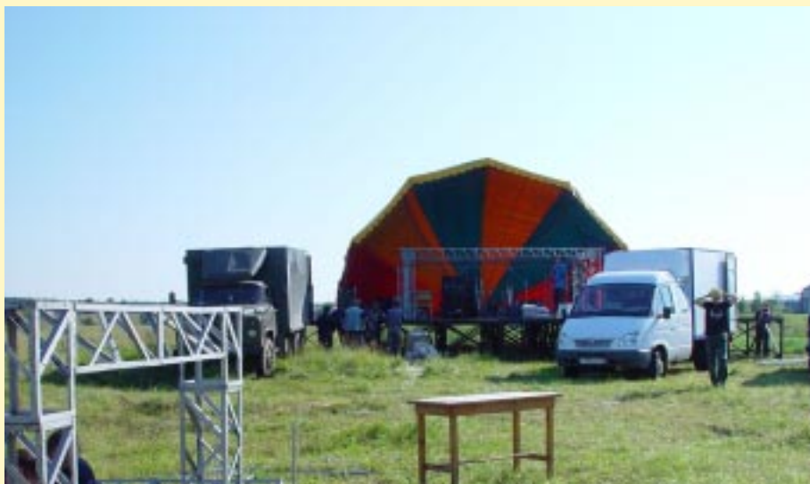
В чистом поле... Здесь все и произойдет.