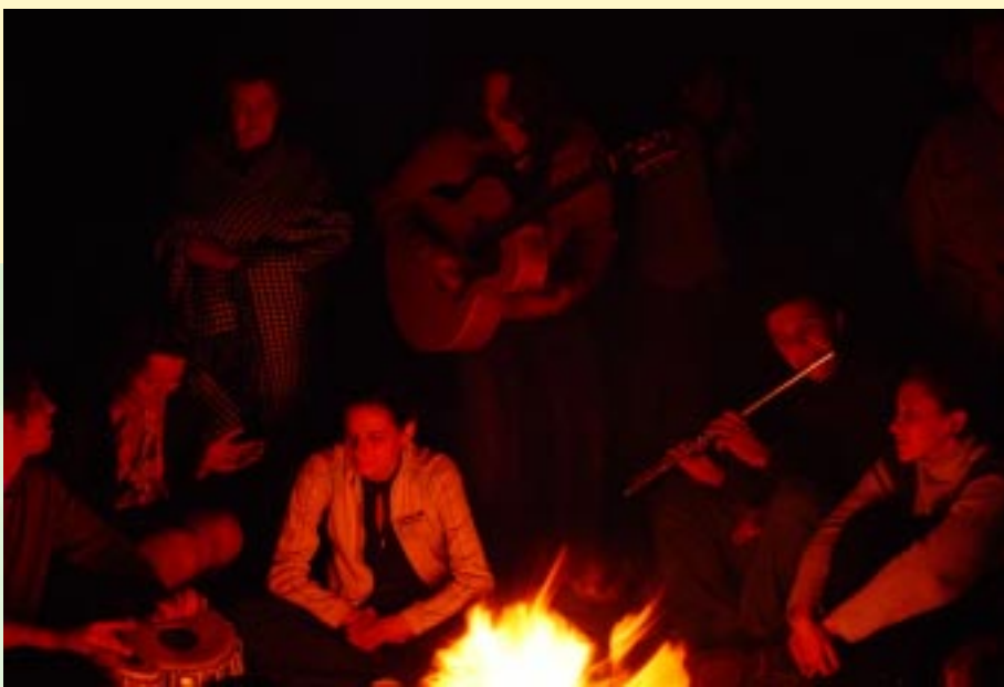
Концерт после концерта.