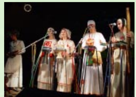
«Огненная птица Тылобурдо».