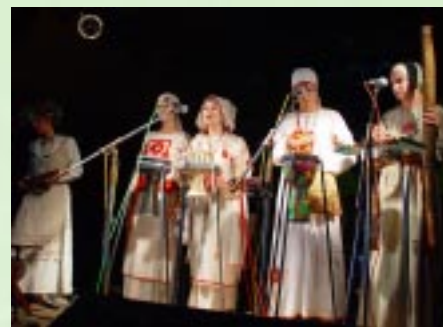
«Огненная птица Тылобурдо».