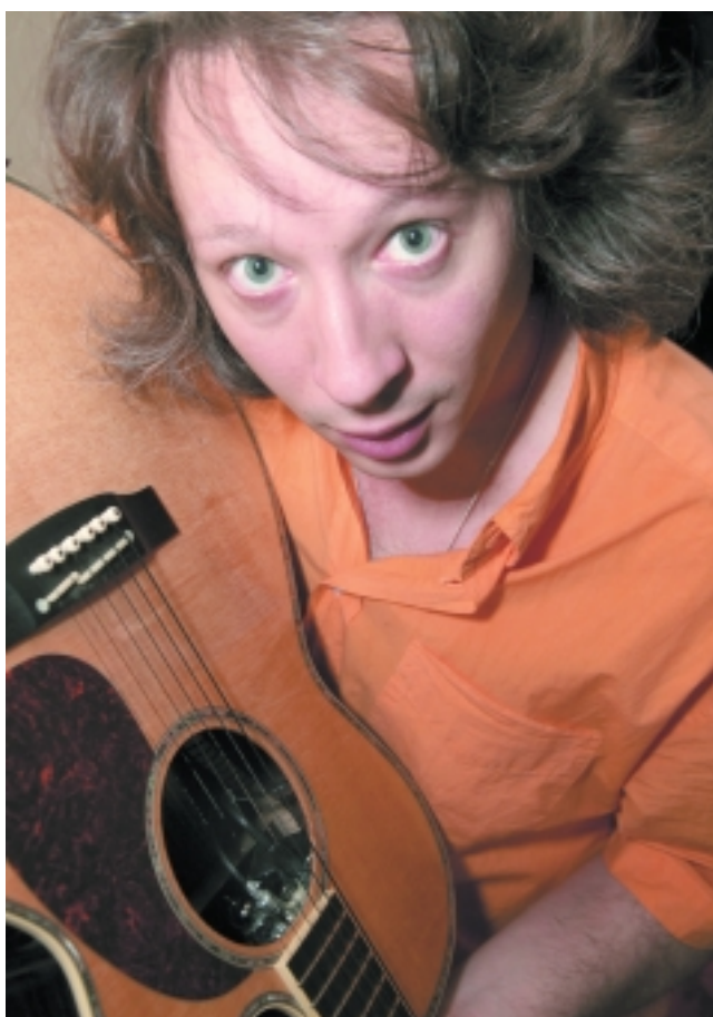
Takamine с ламповым пре-ампом