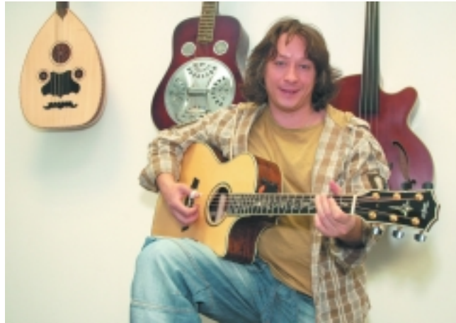
Гитара Taylor Presentation

Еще хочу записать альбом инструментальной музыки и альбом песен друзей. Сам я песен не пишу. Если что-то делать, то надо делать максимально хорошо, и я понимаю, что в написании песен я не буду первый парень на деревне. Действую по принципу «можешь не писать – не пиши». А то сейчас мне как продюсеру